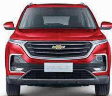
● Rojo Ardiente