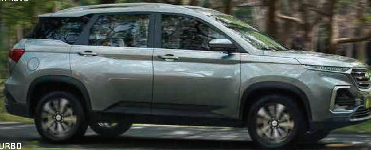
CHEVROLET CAPTIVA TURBO