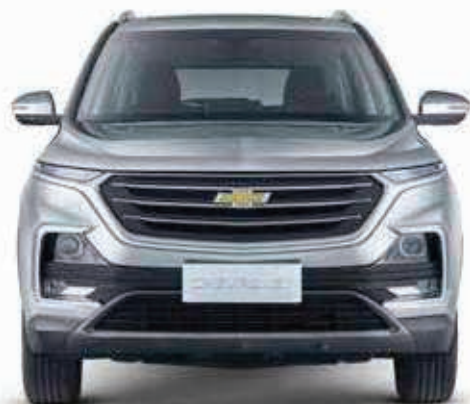
● Plata Sable

Su diseño sorprendente se ve bien en cualquier color.