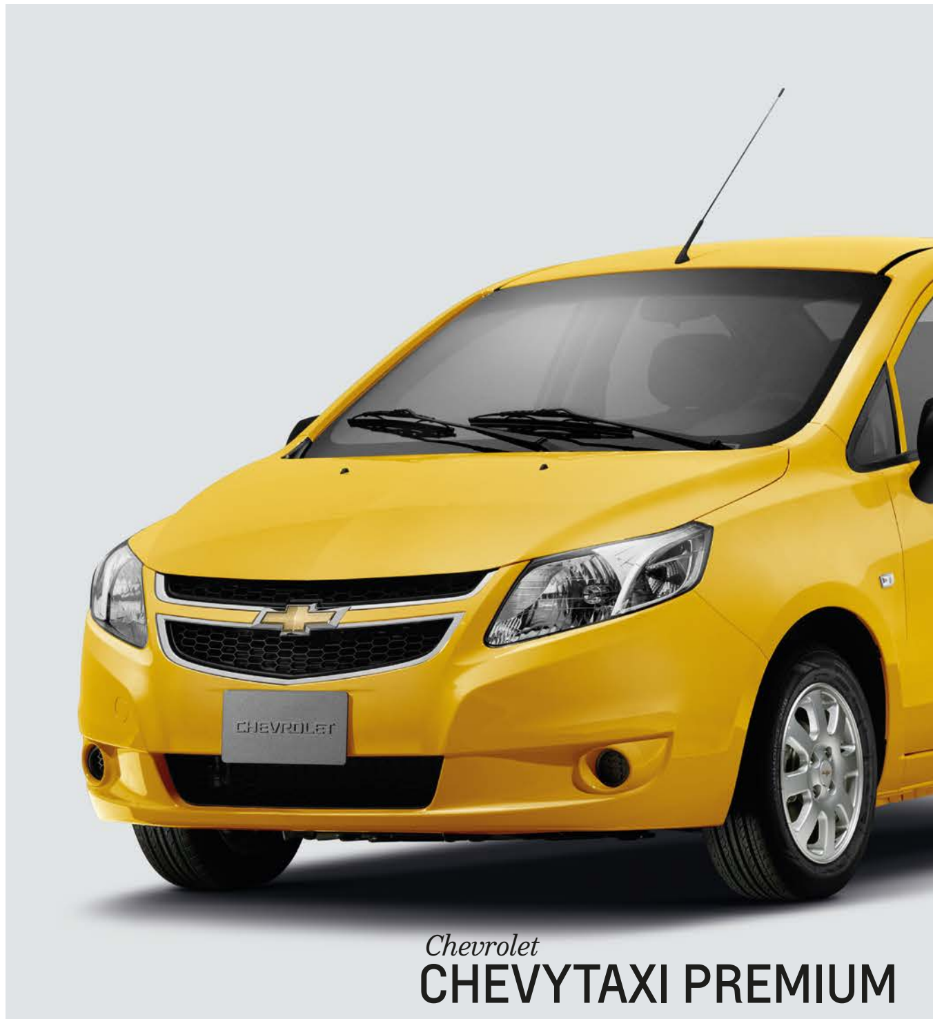
Chevrolet CHEVYTAXI PREMIUM

Por todo esto, el Chevrolet Chevytaxi Premium será su mejor opción a la hora de elegir un taxi de alto nivel.