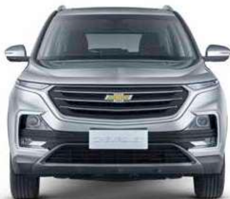
● Plata Sable

Su diseño sorprendente se ve bien en cualquier color.