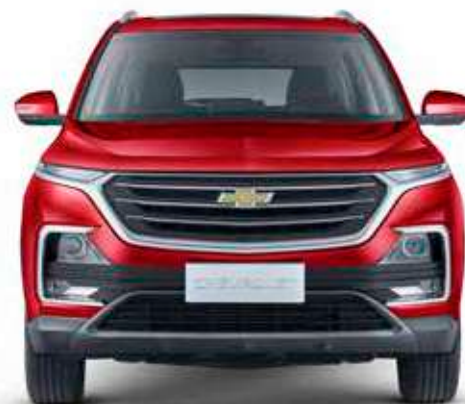
● Rojo Ardiente