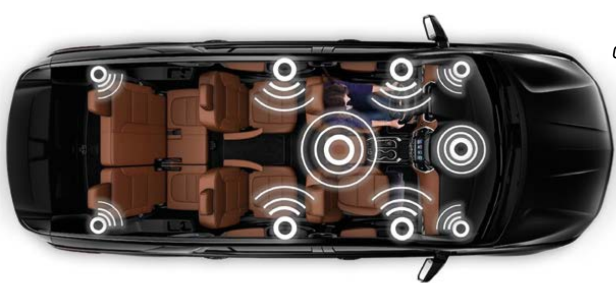
SISTEMA DE SONIDO BOSE 10 ALTAVOCES