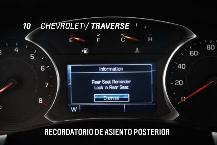
RECORDATORIO DE ASIENTO POSTERIOR