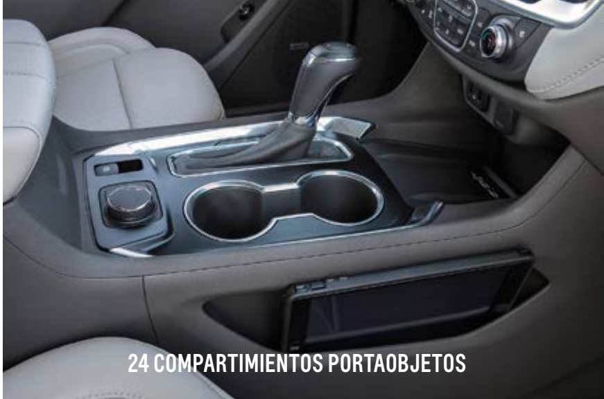
24 COMPARTIMIENTOS PORTAOBJETOS