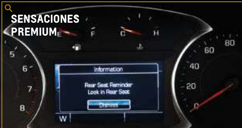
RECORDATORIO DE ASIENTO POSTERIOR

Chevrolet Traverse ha sido especialmente desarrollada para ofrecer el más alto nivel de confort y practicidad para sus 7 ocupantes brindando una experiencia premium. Por ello, se cuenta con avanzadas tecnologías: