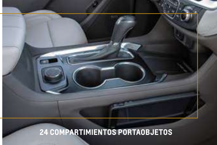
24 COMPARTIMIENTOS PORTAOBJETOS

/ A lo largo de todo el vehículo, se cuenta con 24 lugares de