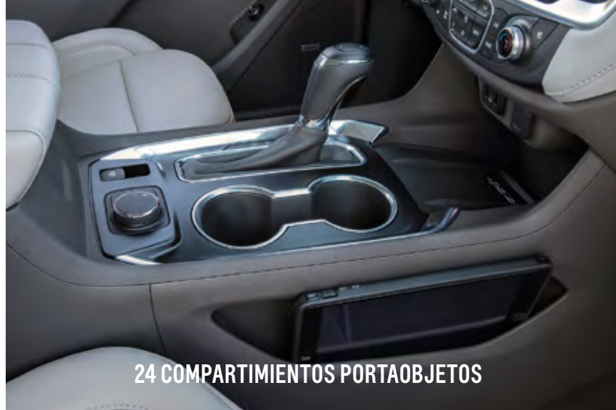
24 COMPARTIMIENTOS PORTAOBJETOS