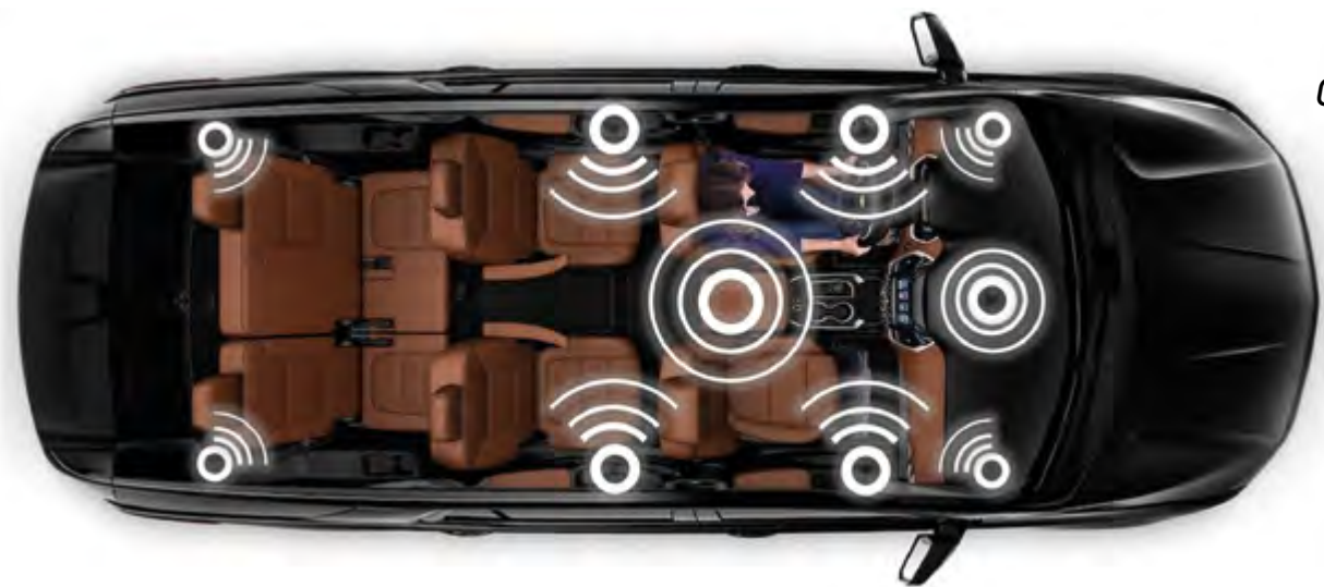
SISTEMA DE SONIDO BOSE 10 ALTAVOCES