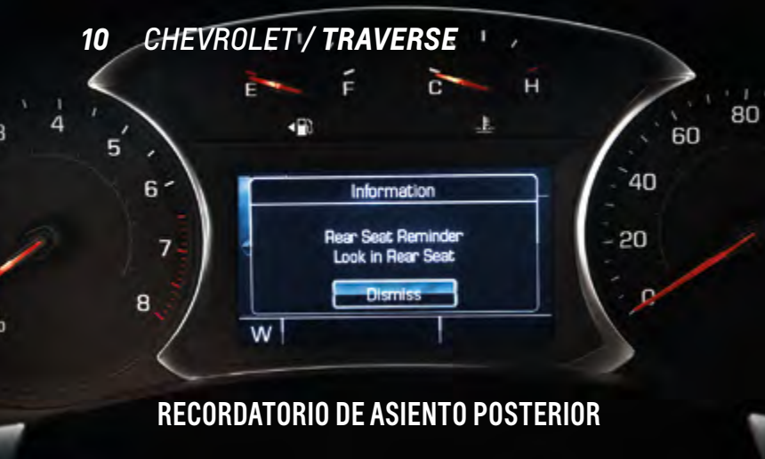
RECORDATORIO DE ASIENTO POSTERIOR